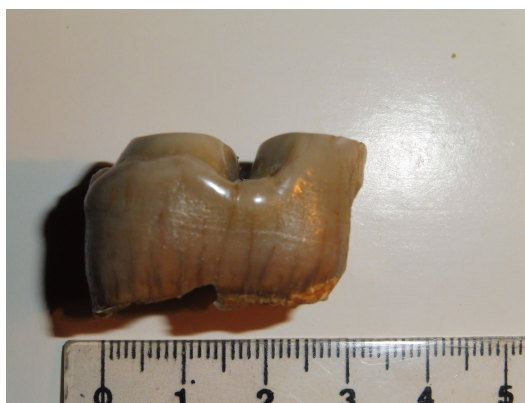
Figura 4: Fragmento de PM3 izquierdo vista lingual

Incompleto al carecer de la muralla externa, del ectólofo y de las raíces. El gancho está roto. El esmalte está finamente estriado horizontalmente, verticalmente en el área de oclusión y es liso en el cordón de cingulo. El mayor grosor de esmalte se alcanza en el extremo lingual de ambos lófos (2,0) y el mínimo (1,3) en la pared interna de éstos.