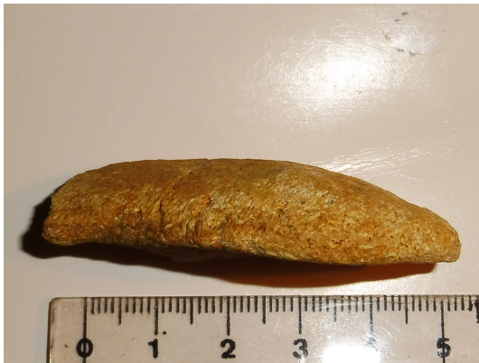
Figura 3: Vista lateral coana derecha

En su conjunto, los dos fragmentos son gráciles, delgados y estrechos. El izquierdo corresponde al extremo propiamente del nasal, el derecho permite en su conjunto apreciar una forma grosso modo de lágrima con la parte ensanchada en posición casi anterior. Inferiormente las coanas son lisas, aplanadas y sólo se tornan ligeramente cóncavas al alcanzar el borde externo ligeramente recreado, más rugoso y con mayor densidad de forámenes que la superficie dorsal.