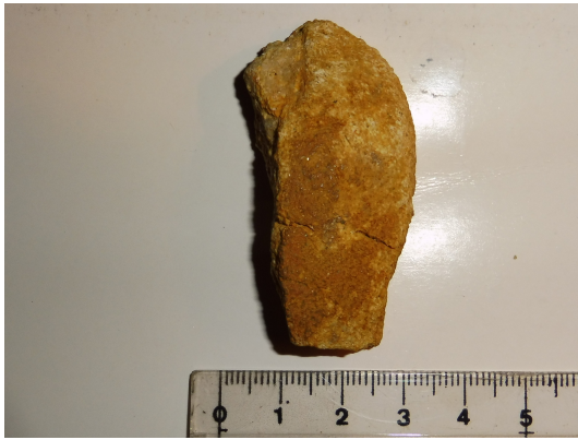
Figura 2: Vista superior fragmento coana derecha