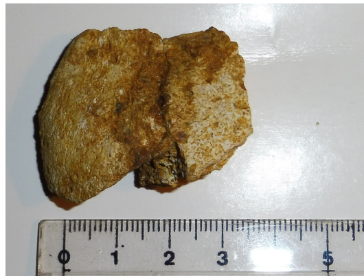
Figura 1: Vista superior fragmento coana izquierda

Se han recuperado varios fragmentos del hueso nasal los dos más relevantes corresponden al extremo de las coanas. La superficie no es lisa dado que exhibe una mínima rugosidad a modo de haces entre los que se intercalan, muy dispersos, pequeños forámenes. No hay un abultamiento como tal aunque sí un recrecimiento.