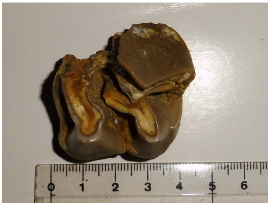
Figura 6: M2 izquierdo vista oclusal

Para descripción y medidas (GARCÍA-FERNÁNDEZ, 2016).