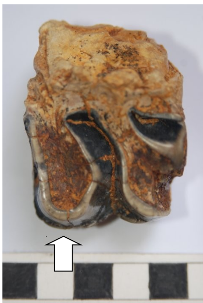
Figura 3. Vista oclusal (La flecha indica el área ampliada).