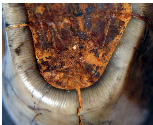
Figura 4. Extremo lingual del protofolo con estriación del esmalte dental.