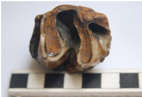
Figura 1. Vista oclusal (La flecha indica el área ampliada).

Carece del ectolofa. Esmalte grueso (Máx.: 3.5 extremo lingual protolofa / Mín.: 0.7 pared interna valle medio) estriado en la base del protolofa y del metalofa y en las áreas expuestas al uso / masticación donde se ha medido su grosor. Protocono sin señalar. Valle medio ancho y profundo. Sin gancho, en su lugar hay una ondulación del esmalte.